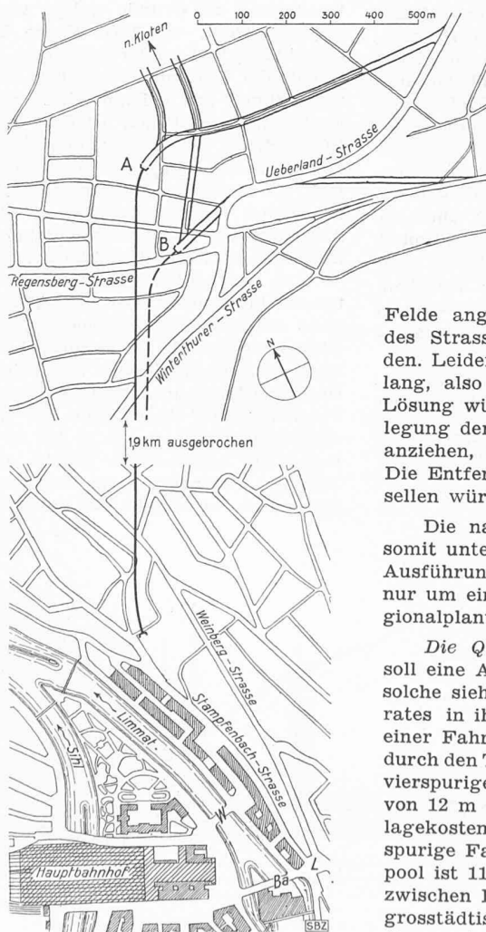
Bild 1. Strassentunnel durch den Milchbuck in Zürich, Lageplan 1:15000. Ba Bahnhofbrücke, L Leonhardplatz, W Walchebrücke, A, B Nordportal