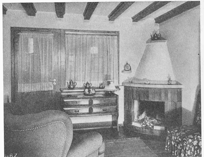
Bild 3. Wohnzimmer, gegen die Wohnküche

Ilford erfolgte durch das Aufstellen von fertigen Satteldach-Rahmen aus Eisenbeton, wobei das Flachdach des alten Baues den Boden der neuen Hallen bildete. Die Rahmen weisen eine Spannweite bis 16,5 m auf, sie sind auf dem alten Bau gelenkig aufgelagert (Zweigenkrahnen) und bestehen aus drei Gliedern, zwei Stielen und einem Satteldachbinder. Der Zusammenbau der drei Elemente erfolgt durch Verzahnung und Verbindung der Verzahnungen mittels je zwei Schrauben aus Flusstahl; die verzahnten Fugen sind ungefähr an der Stelle der Momentennullpunkte angeordnet. Der Abstand der Rahmenbinder beträgt 5,05 m. Die Pfetten sind ebenfalls Fertigt balken aus Eisenbeton von 2,5 cm Breite und 3,8 cm