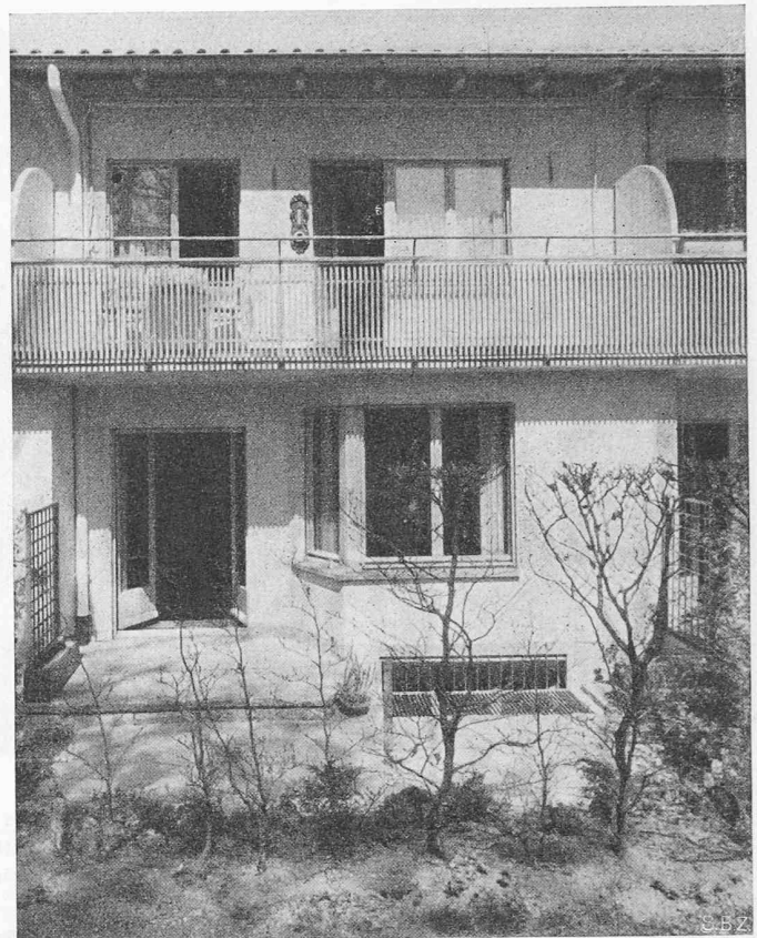
Bild 7. Detail der Parkfassade der Reihenhäuser am Artergut von