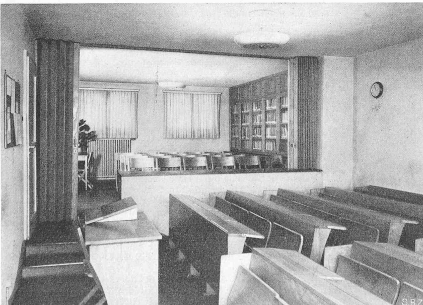
Bild 6. Vortragsraum und Bibliothek im Psychotechnischen Institut

Höhe, ihr Abstand beträgt 1,22 m. Die Dachdeckung ist aus Eternit. — Beim Wiederaufbau einer Fabrik in Clapton ist man folgendermassen vorgegangen: Die Eisenbetonkonstruktion des Erdgeschosses und des 1. Geschosses (zwei Felder von je 6 m Breite, Unterteilung längs je 4,30 m) setzt sich aus fertigen Pfeilern, Unterzügen und Balken zusammen, während das Dachgeschoss aus Rahmenbindern (wie jene von Ilford) besteht. Die Pfeiler in der mittleren Längsaxe des Baues sind mit beidseitiger Auskrägung gegossen, sie haben also T-Form und tragen an den Enden ihrer Auskrägungen mittels Verzahnung die Unterzüge. Die satt aneinander liegenden Balken der Decke dienen zugleich als Schalung für den Ueberbeton. Der Verbund zwischen Ueberbeton und Stützen sowie Unterzügen wird durch Verankerungseisen gewährleistet. Die zusätzlich armierte Decke hat eine Gesamtdicke von 15 cm. — In Kent sind Shedbauten aus fertigen Eisenbetonelementen errichtet worden. Ihre Abmessungen sind folgende: Stützweiten quer (= Shed-Stützweiten): 3 \times 11 m; Länge 122 m, Stützweiten längs: aussen 4,60 m, innen 9,20 m. Die Stützen sind in den Fundationen eingespannt. Die Konstruktion setzt sich pro dreifachen Shedbinder, begriffen die Stiele der beiden Aussen-