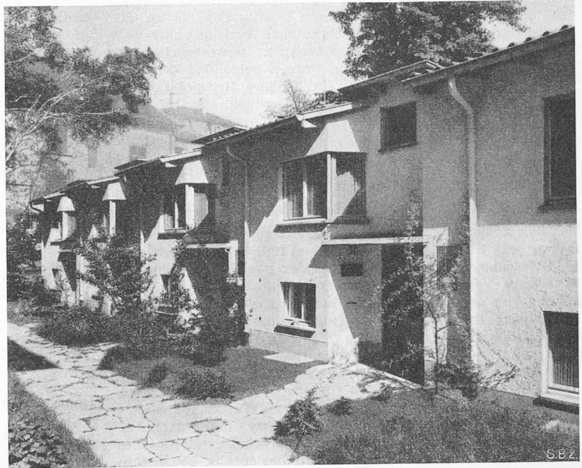
Bild 1. Die Hausreihe am Artergut aus Nordwesten gesehen

Fertige Bauelemente aus Eisenbeton für industrielle Anlagen in England sind in der Oktober-Nummer 1947 von «Concrete and Constructional Engineering» beschrieben. Die Aufstockung eines bestehenden industriellen Gebäudes in