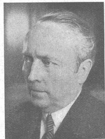
Präsident Rohn 70 Jahre s. Seite 190

Mosse-Annoncen AG., Zürich, Limmat- quai 94 / Tel. 32 68 17 / Postcheck VIII 1027