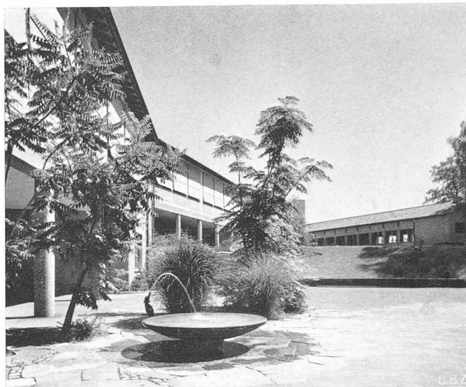
Bild 22. Schulhaus Felsberg, Nr. 11 in Bild 6. Arch. JAUCH & BÜRGI