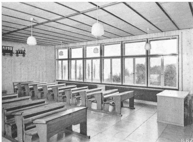
Bilder 23 und 24. Schulpavillon am Richard Wagnerweg (Nr. 12 in Bild 9), STÄDT. HOCHBAUAMT. Grundriss 1 : 300