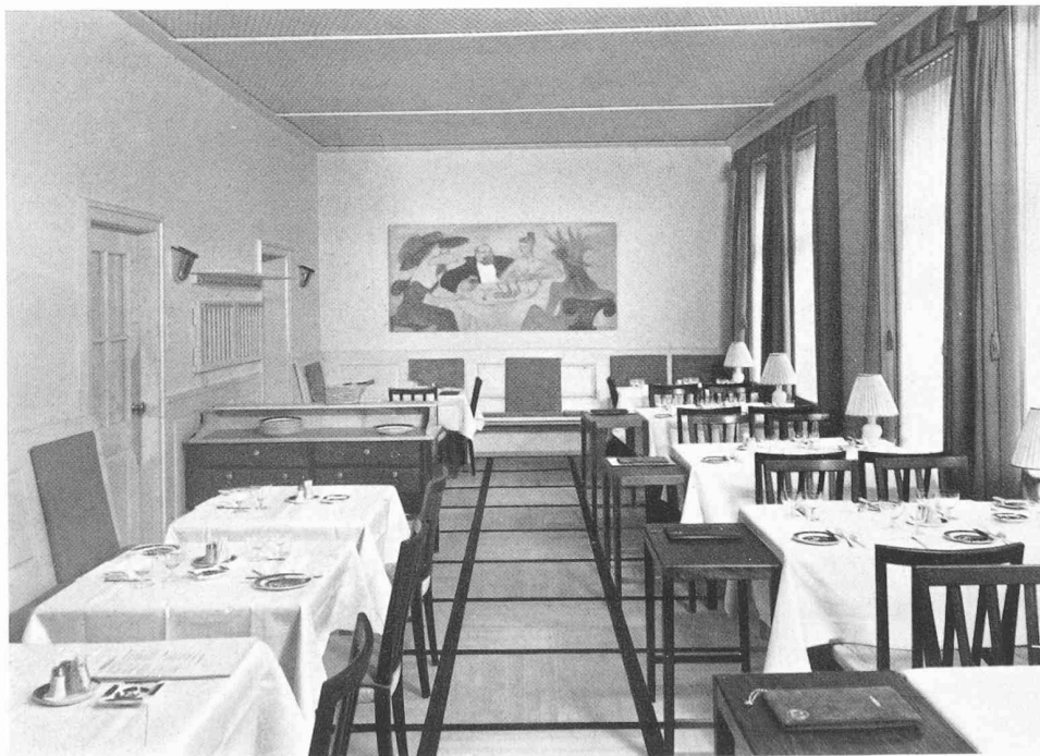
Architekt E. EGELER, Mitarbeiter Innenarch. W. FREY, Basel