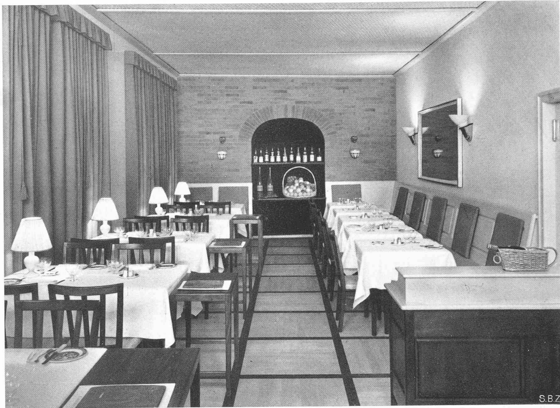
Der Speisesaal im ersten Stock des «Gambrinus» in Basel