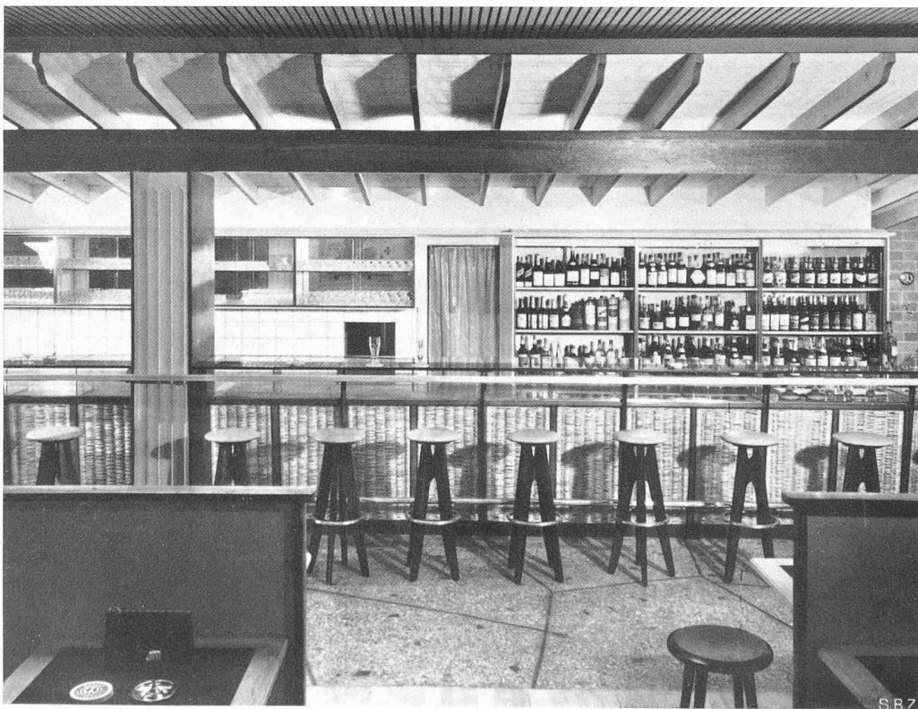
Architekt E. EGELER, Mitarbeiter Innenarch. W. FREY, Basel