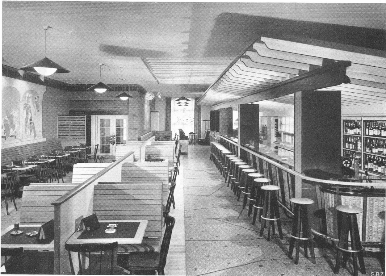
Restaurant und Brötlibar im «Gambrinus» in Basel