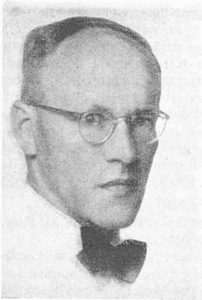
J. WIPF ARCHITEKT