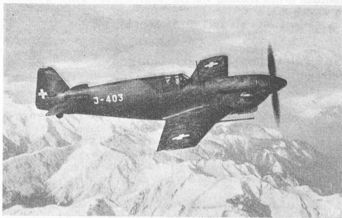
Bild 1. Ansicht des Jägers D 3802 A im Flug

Wie liegen nun die Verhältnisse am Tré-la-Tête-Gletscher im Hinblick auf die Untergletscher-Wasserfassung? Die Zunge des rd. 7,2 km langen Eisstromes mit 10,8 km^2 Oberfläche reicht auf 1900 m Meereshöhe herunter, während der Wasserspiegel an der Entnahmestelle auf Kote 1921,50 m vorzusehen war. Da der Gletscher in eine steile Fels-Schlucht ausmündet, durfte von Anfang an damit gerechnet werden, dass die Wasserfassung in nicht allzu grosser Entfernung vom Gletscherende erstellt werden könnte. Mit einem 300 m langen, durch das Eis vorgetriebenen Horizontalstollen wurde der Verlauf des Gletscherbaches unter dem Eis ermittelt und dabei festgestellt, dass dieser Bach eine tiefe, drei bis sechs Meter breite Erosionsrinne ausgefressen hatte. Der gesamte Gletscherabfluss konnte in dieser, übrigens stets eisfreien Felsrinne ohne besondere Schwierigkeiten hinter einer Ueberlaufstauwand gefasst und durch einen Stollen abgeleitet werden, wie wenn es sich um die Wasserentnahme aus einem Wildbach unter freiem Himmel gehandelt hätte. Zudem weist die Sohle des Wasserlaufes unter dem Gletscherende ein so grosses Längsgefälle auf, dass die Nebeneinrichtungen der