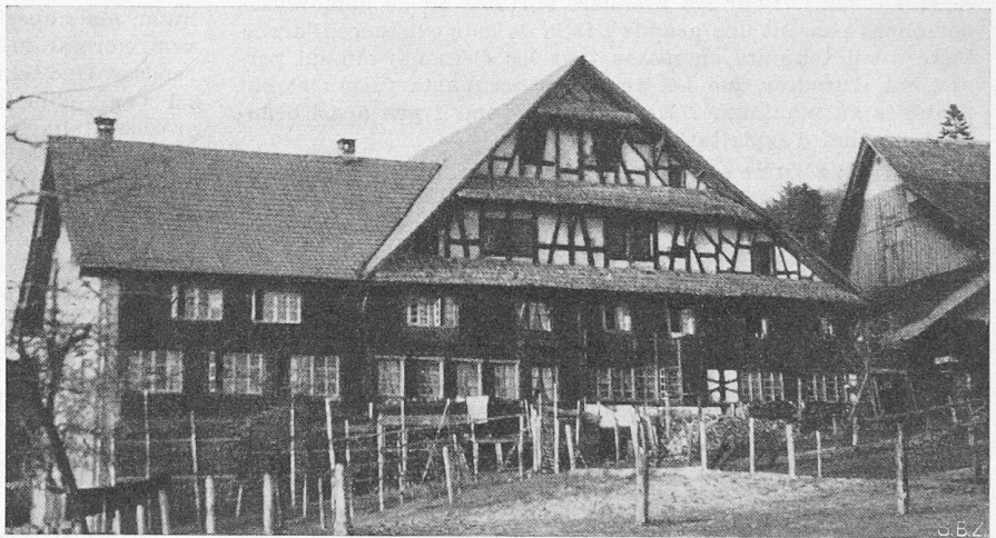
Bild 4. Bauernhaus im Ober-Albis. Wohnteil Blockbau, Giebel Riegelbau

und Ausschau nach wertvollen Objekten gehalten, die später eingehend besichtigt, photographiert, gezeichnet und beschrieben werden. Leider sind sehr viele Häuser im Innern modernisiert worden, wertvolles Mobiliar wurde verschleudert. Manch ein Objekt konnte der Schreibende durch rechtzeitige Beratung des Besitzers noch vor der Verschandelung bewahren.