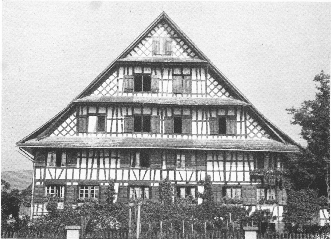
Riegelhaus in Rifferswil, Bezirk Affoltern