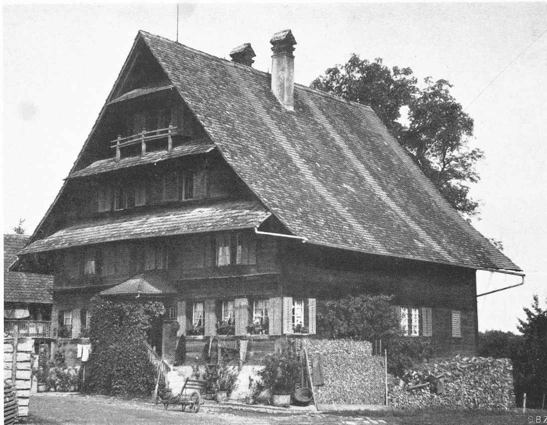
Ständerhaus in Mettmenstetten, Kt. Zürich

Unten: Gekerbte Inschrift und Fensterdetail