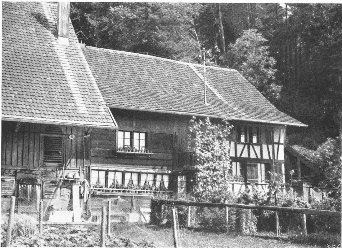
Schweikhof, Gemeinde Hausen am Albis. Kombinerter Riegel- und Blockbau