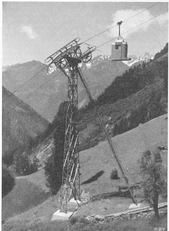
Bild 3. Stütze der Einseilbahn Bristen-Golzern, Kanton Uri