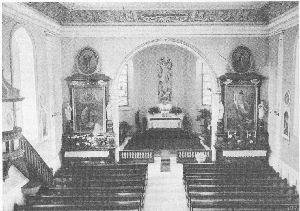
Bild 3. Chorpholie vor der Umgestaltung