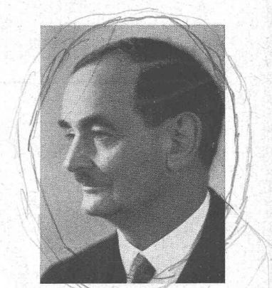
Prof. Dr. Dr. h. c. ARTHUR STOLL, Basel, der neue Präsident der G. E. P.