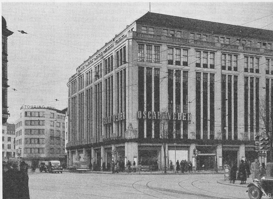
Bild 4. Warenhaus ehem. Brann, 1910 (erhöht 1928), Arch. PFLEGHARD & HAEFELI