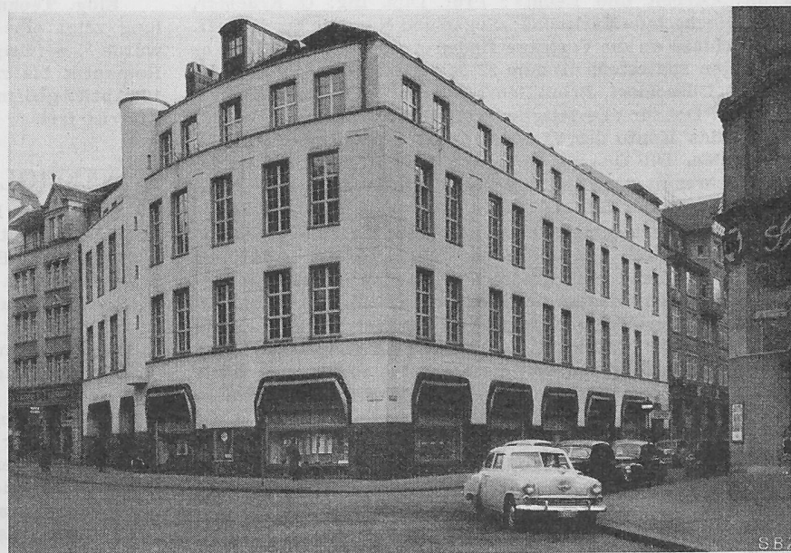
Bild 5. Telephonegebäude Fusslistrasse, 1925, Arch. PFLEGHARD & HAEFELI