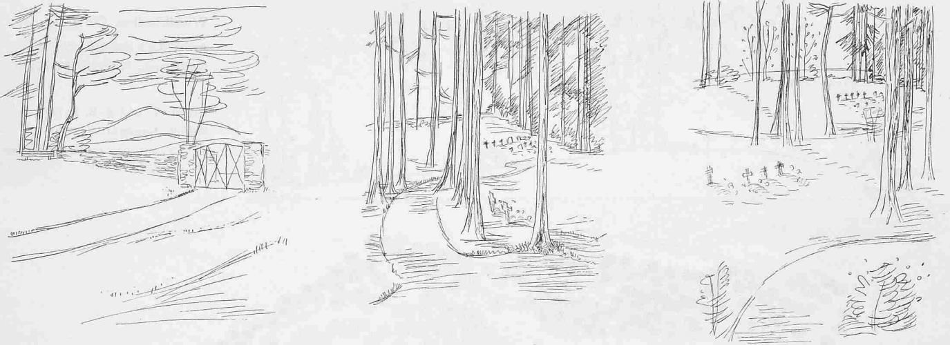
Skizzen des Architekten Rolf Hässig zum Entwurf des Waldfriedhofs in Gossau; Text siehe Seite 514