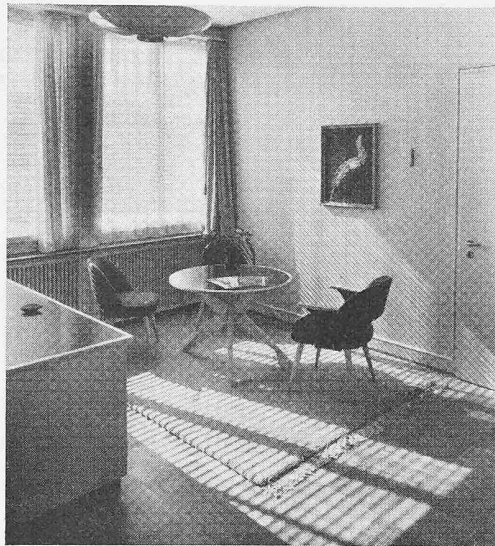
Bild 15. Direktionszimmer

Eine Holztagung in Salzburg findet vom 16. bis 21. Juni 1952 statt. Veranstalter sind die Oesterreichische Gesellschaft für Holzforschung (OeGH), die Deutsche Gesellschaft für Holzforschung (DGfH) und die LIGNUM, Schweizerische Arbeitsgemeinschaft für das Holz. Zweck ist die Förderung des Zusammenwirkens der an der Holzforschung beteiligten Wissenschaftler und interessierten Praktiker und die Orientierung über neue Erkenntnisse und Möglichkeiten bei der Verwertung des Holzes. Dieser Zweck soll durch Vorträge und Be-