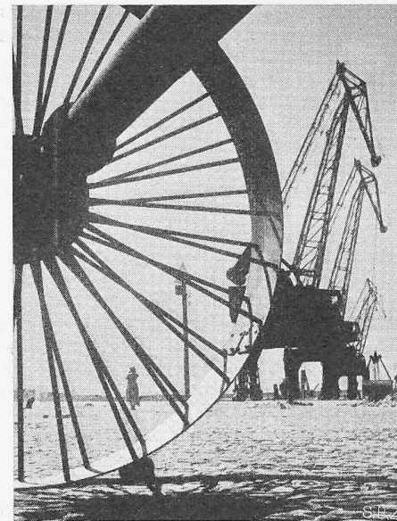
3. Preis ex-aequo, Photo von V. de Maer , Vilvorde

dem nur 36jährigen Ingenieur die Leitung der Bauten des Südportals des grossen Tunnels in Goppenstein anzuvertrauen. Die Verantwortung war für den jungen Mann oft schwer, und seine Lebensgefährtin, die er 1941 verlor, hat mit ihm die Jahre in Goppenstein, wo im Winter die Lawinen niederkrachten, tapfer durchgehalten. Das Werk hat ihn für sein Leben mit der Schweiz verbunden, und er erwähnte gern und mit Stolz, dass er Ehrenbürger von Ferden im Lötschental sei.