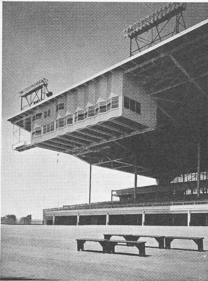
2. Preis