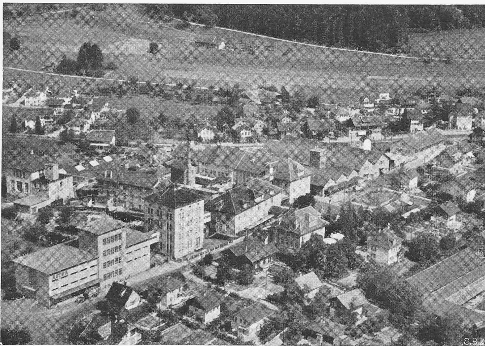
Bild 1. Fliegerbild der «ASTRA» Fett- und Oelwerke AG. in Steffisburg

Bild 1 gibt einen Ueberblick über die gesamten Neuanlagen nach Fertigstellung der hier beschriebenen Neubauten, während im Lageplan (Bild 2) die Neubauten besonders hervorgehoben sind.