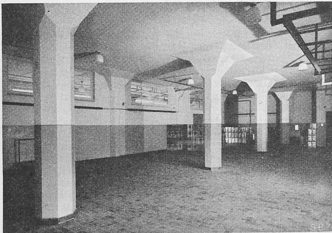
Bild 32. Oelabfüllerei, Raum im Erdgeschoss

1. In den bundesrätlichen Erwägungen wird festgestellt, dass die Stadt Winterthur noch keine Konzession zur Entnahme von Trinkwasser aus dem Grundwasserstrom südlich Rheinau besitze. Diese Feststellung trifft zu. Es trifft aber