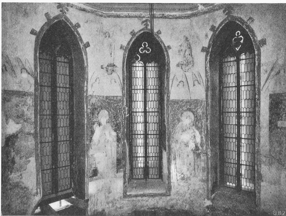
Bild 3. Der Chor der reformierten Pfarrkirche von Pratteln (Baselland) mit den während der Restauration freigelegten gotischen Wandgemälden vor ihrer Zerstörung (einzig diese Aufnahme wurde vom Verfasser leicht retuschiert, um zu zeigen, wie die Gesamtwirkung nach einer Restauration der Gemälde ungefähr gewirkt hätte). Links vom Mittelfenster Maria mit Kind

Ueber die Zulässigkeit oder Wünschbarkeit von Bildern in reformierten Kirchen gehen die Meinungen selbst kirchlicher Kreise bekanntlich weit auseinander. Eine Instanz, die autoritativ darüber entscheiden könnte, gibt es nicht, und so greift man gern auf den Standpunkt der Reformatoren zurück, ohne dass dieser jedoch verbindlich wäre. Es gibt innerhalb der reformierten Kirche eine Strömung, die ausdrücklich Bilder, Farbenfenster und liturgische Bereicherungen des Gottes-