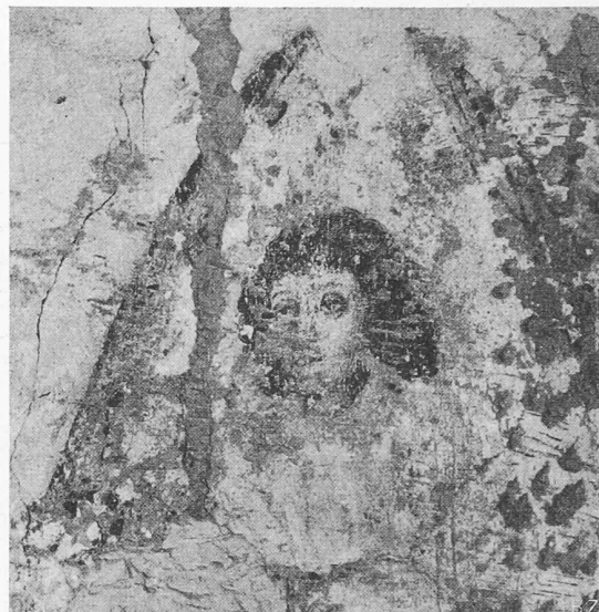
Bild 2. Engelsköpfchen vor der Zerstörung, die vorzügliche Zeichnung ist trotz dem mangelhaften Erhaltungszustand klar erkennbar

uns an den Fall von Stammheim, wo die Kirche «aus Versehen» nicht abgeschlossen wurde, bis die neu aufgedeckten Malereien zerkratzt waren (siehe SBZ Bd. 82, S. 111*, 1. Sept. 1923), und inzwischen ist da und dort doch noch Köpfe und Winkel gibt, die seit 1529 nicht mehr gelüftet worden sind. Und peinlich ist es zu denken, dass es eine Art kirchlicher Knüppelgarden oder Rollkommandos offenbar als ständige Einrichtung gibt, «sanctae simplicitates», die zur Verfügung stehen, das zu tun, was der Herr Pfarrer oder Kirchenpfleger nicht gerade selbst besorgen will, von dem er aber wünscht, dass es besorgt wird — worüber das Nötige im Faust II bei der «Liquidation» von Philemon und Baucis nachzulesen ist.