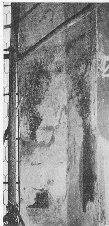
Bild 4. Das Marienbild nach seiner Zerstörung durch barbarische Bilderstürmer