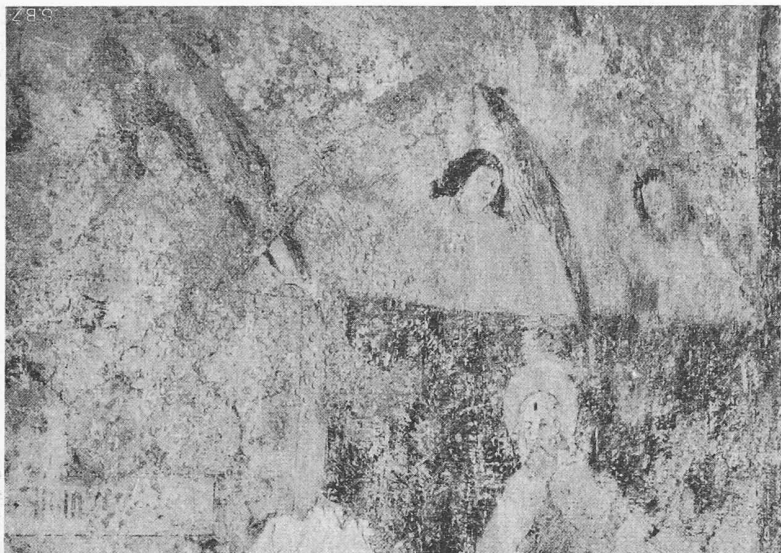
Bild 1. Ausschnitt vom Engelfries — die Engelchen halten die (gemalten) Wandteppiche mit den Apostelfiguren