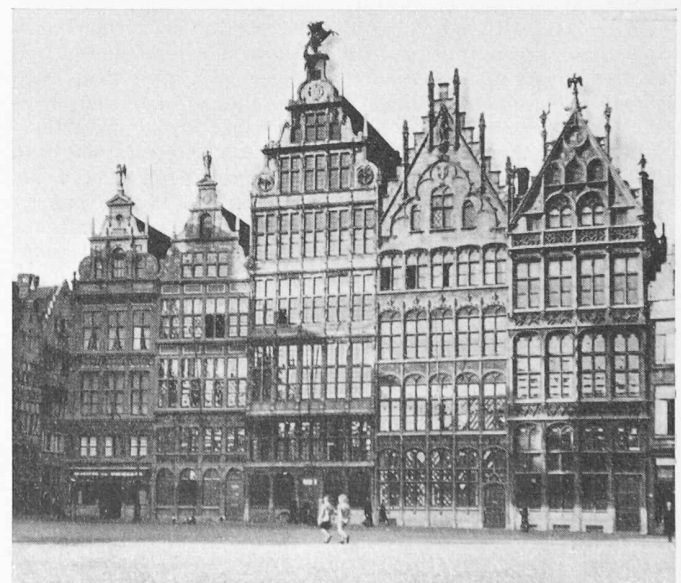
Bild 1. Niederfränkische verglaste Skelettbauten aus vier Jahrhunderten am Grossen Markt in Antwerpen

Eine Maschinenfabrik, eine Spinnerei oder Weberei wird auch in unserm Alpenraum als Stahlbetonskelett mit viel Glas gebaut, ohne dass man sich deshalb als besonders modern vor- kommt. Bei einem neuzeitlichen Wasserkraftwerk ist diese