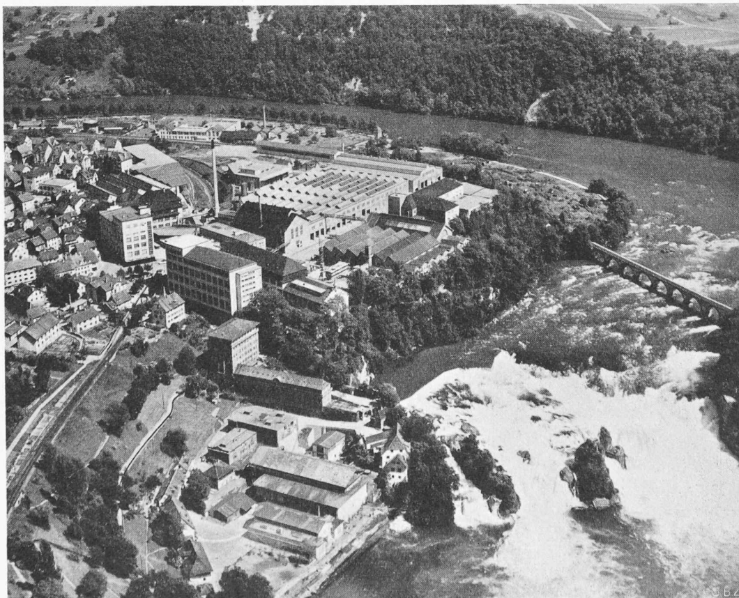
Bild 1. Die Werkanlagen der SIG unmittelbar über dem Rheinflall