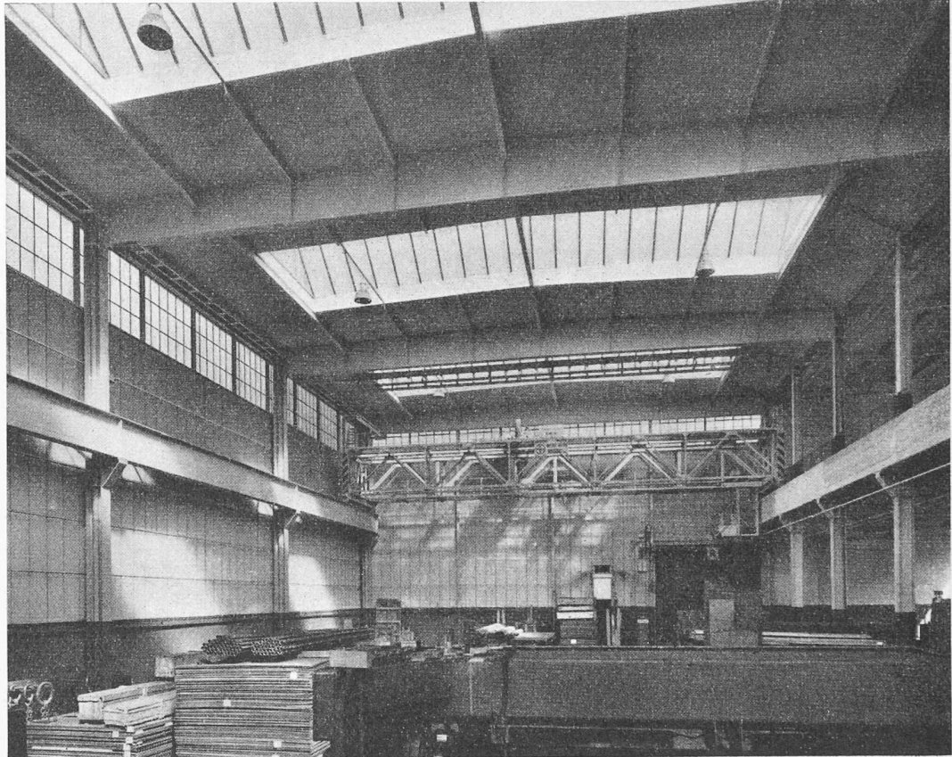
Bild 1. Blick in die Bearbeitungshalle; rechts Eisenbetonbrüstungsträger als Kranbahnträger

Mit Rücksicht auf eine gute Ausnutzung der Grundrissfläche ist die Lagerhalle zweigeschossig angeordnet mit je 4 t/m 2 Nutzlast. Die Lagerräume werden bedient durch fahr-