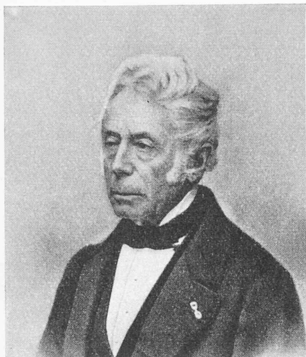
PIERRE-JOSEPH MARGUET, 1785—1870