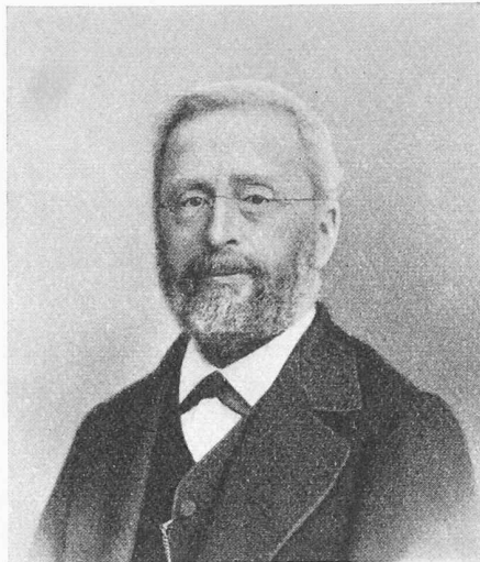
JULES MARGUET, 1818—1888

von 1853 bis 1887 abwechselungsweise geleitet haben