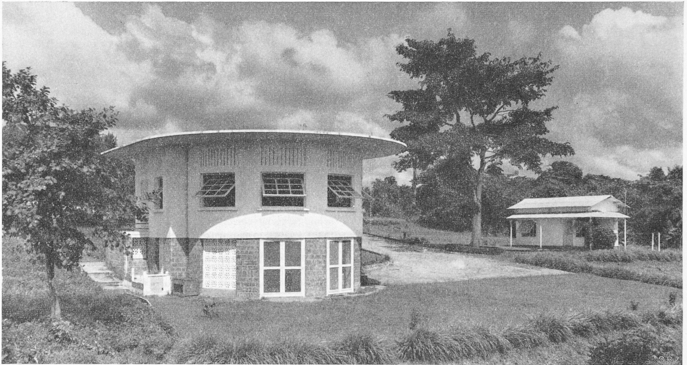
Bild 1. Schweizerische Forschungsstation an der Elfenbeinküste, Blick auf die Hauptfassade des Laboratoriums, im Hintergrund das Wohnhaus des Verwalters

gliedern (oder Suppleanten) des Forschungsrates zur Prüfung übergeben wird. Diese Referenten prüfen die Gesuche, wobei sich besonders auch die persönliche Aussprache mit dem Gesuchsteller als nützlich erwiesen hat. Der Antrag des Referenten wird in einer spätern Sitzung des Plenums behandelt und der Forschungsrat entscheidet auf Annahme, Ablehnung oder in zweifelhaften Fällen auf nochmalige Behandlung in einer spätern Sitzung.