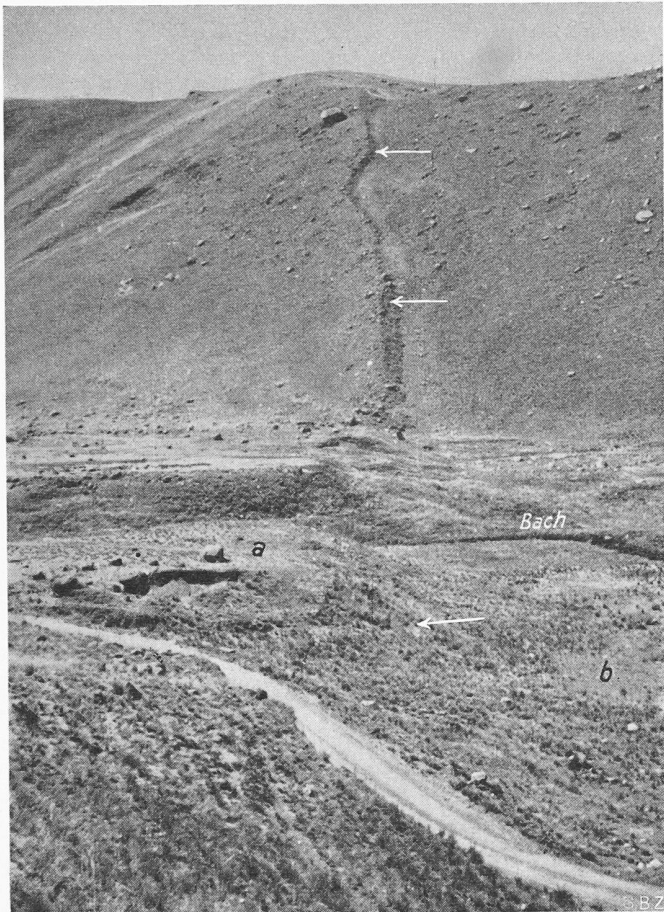
Bild 3. Auf diesem Bild verläuft der Bruch (weisse Pfeile) im Hintergrund durch einen Seitenmoränenkamm. Im Vordergrund wurde die Alluvionalebene des Baches verworfen (Höhenunterschied zwischen a und b etwa 10 m).

grösser ist auch die auf sie bei einem Beben einwirkende Beschleunigungskraft. Dünnere Bogen können sich leichter an eine Ausweitung des Tales anpassen als dickere. Hierbei ist aber auch klar, dass zwar der Einfluss einer angenommenen Talausweitung auf die Beanspruchung der Bogen ohne weiteres ermittelt werden kann, dass aber eine sichere Abschätzung der Vorgänge bei solchen Naturkatastrophen selbstverständlich unmöglich ist.