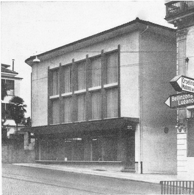
Casa Mornaghini a Locarno-Muralto

sfruttamento del quale si è utilizzato un muro esistente oltre il quale la casa sporge leggermente a sbalzo. Tutti i locali danno sul grande vano d'abitazione, suddiviso in parte da una terrazza interna. Da notare in modo particolare il grande camino entro nicchia e il soggiorno esterno coperto. Costo al m 3 Fr. 98.— (538 m 3 ).