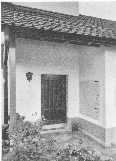
Bild 1. Hauseingangspartie, rechts neben der Haustüre die Kästen für Zähler und Schaltuhren; daneben die Brief- und Milchkasten.