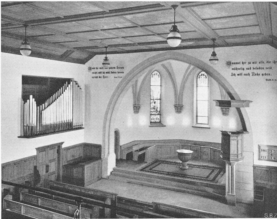
Innenansicht der renovierten Chorpattie

artete Kunst» auf den Scheiterhaufen warf und nur die «staatlich anerkannte» zuließ? Weiss man in Uetikon nicht, wie kurzzeitig es ist, Künstlern gestalterische Fesseln anzulegen? Man könnte den Entschluss wohl noch verstehen, wenn es sich um eine ausgesprochen unkirchliche Türe gehandelt hätte, doch war dieses gerade nicht der Fall. Sie war nur nicht wie die «ändern». Das ist der Hauptgrund ihrer Ablehnung. Bedauerlich, dass man den Mut nicht aufbringt, Kunstwerke, zu denen man selbst vielleicht noch keine Beziehungen hat, zu dulden oder zu erdauern, bis die Beziehungen durch die Auseinandersetzung mit ihnen wachsen. Wie oft kommt es doch vor, dass man seine Anschauungen ändert und Verpöntes allmählich milder beurteilend, schliesslich lieben lernt. (Mir selbst geht es jedenfalls so. Bartöks Musik war mir vor Jahren unerträglich, heute sind mir die Klänge verständlich, und morgen, — so hoffe ich — werde ich sie lieben. Geht es nur mir so?)