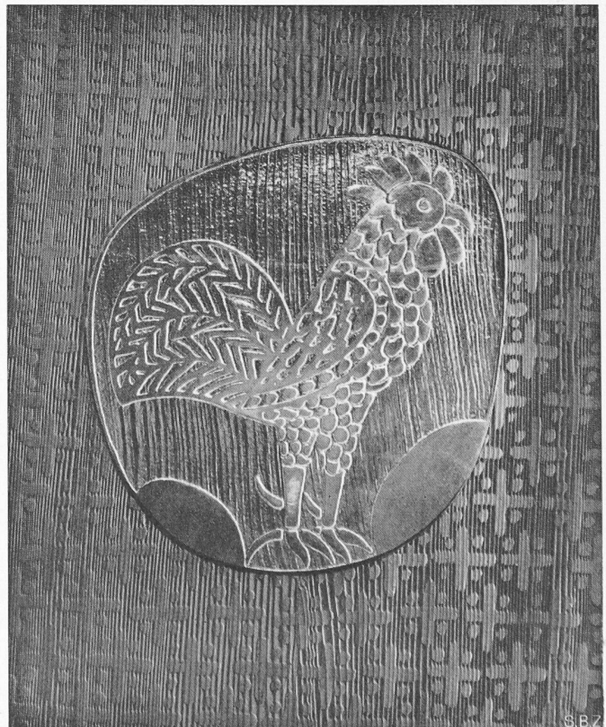
Detail des Chorgestühls, von Max Hunziker

Im SEV sind neben den Fachleuten als persönliche Mitglieder die schweizerischen Institutionen und Firmen, die irgendwie mit Elektrotechnik und verwandten Disziplinen zu tun haben und die Elektrizitätswerke vereinigt; er ist des-