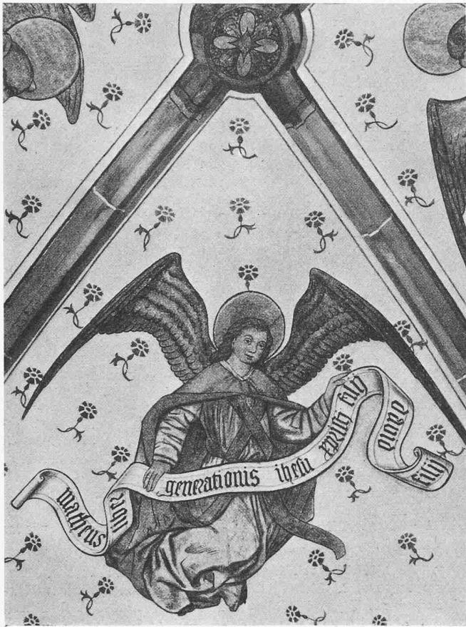
Ausschnitt der Fresken im Chor der Kirche Winterthur-Veltheim, von H. Haggenberg nach 1482 gemalt; der Evangelist Matthäus

weisen und den Fussgänger, der Entspannung sucht, aus dem modernen Verkehrsumult herauszulösen. Wenn ich ins Theater gehe, ist mir eine kurze Schnauppause ausserhalb der Zone kreisender Autobremser nun willkommen.