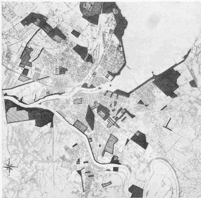
Bild 6. Bestehende Grünzone, Masstab 1:60 000. Die einzelnen Grundstücke sind nicht zusammenhängend. Eigentliche Grünzüge und -verbindungen fehlen noch. Nur die Seeufer sind durch Grün einheitlich gefasst