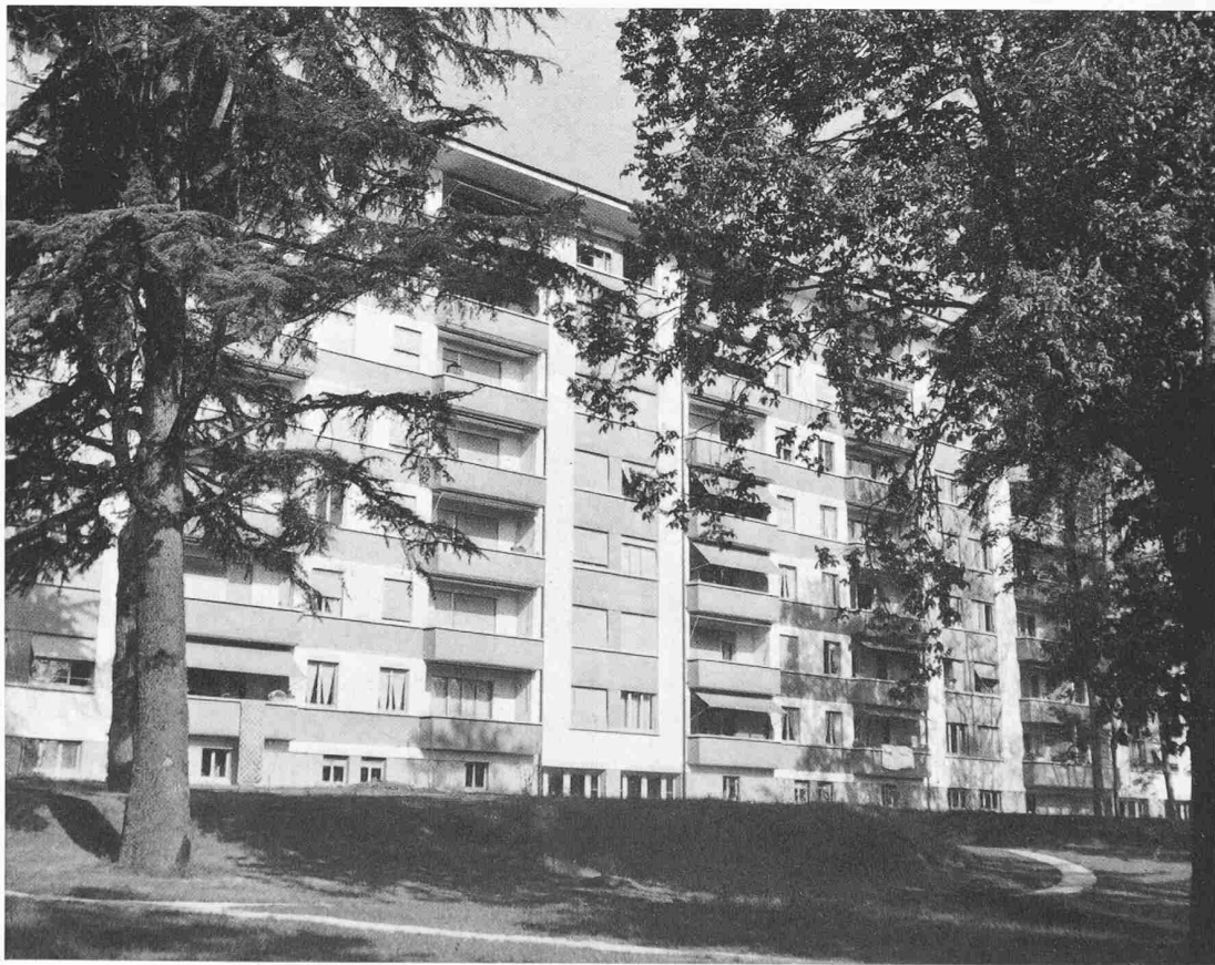
Wohnblock «Montbrillant Parc» aus Osten