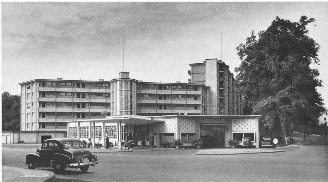
Die in Ausführung begriffene Randbebauung im nördlichen Teil von Vermont, aus Norden. Das in den Park hineinragende Hochhaus fehlt noch