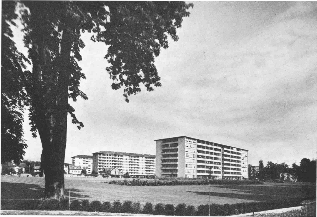
Uebersicht des neuen Quartiers in Beaulieu aus Süden