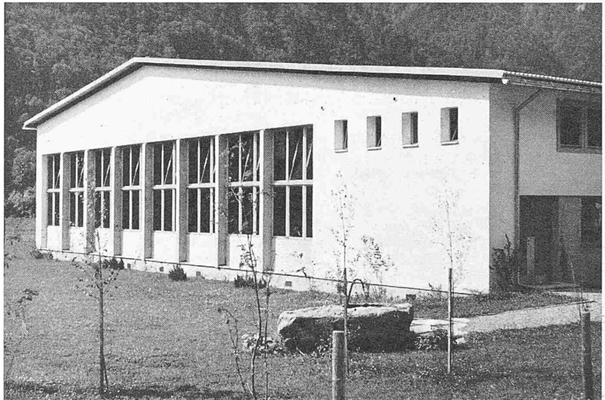
Bild 4. Südfassade