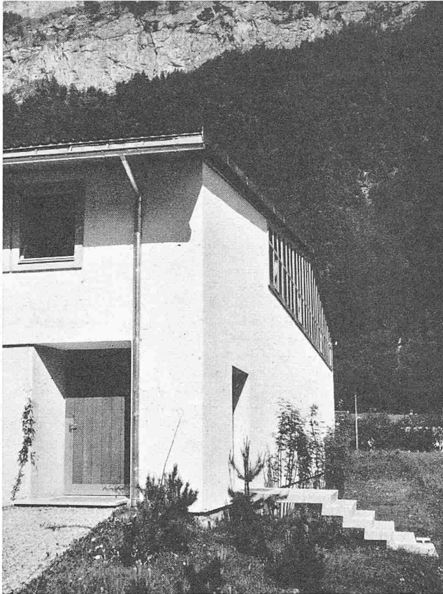
Bild 1. Eckpartie auf der Nord/Ostseite