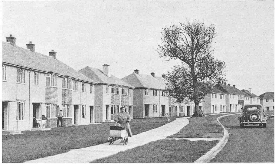
Bild 3. Wohnkolonie in Farnborough, gebaut aus vorfabrizierten Betonelementen

Durch besonderes Gesetz aus dem Jahre 1946 wurde das Ministerium für Hausbau und lokale Behörden ermächtigt, bestimmte Gebiete als Bauplätze für neue Städte zu bezeichnen. Heute sind in Grossbritannien vierzehn neue Städte im Bau. Sie dienen der Dezentralisation der Industrie und der industriellen Bevölkerung. Besondere «Entwicklungskorporationen» übernehmen die Planung und führen die Wohnbauten für die Arbeiterschaft und den Mittelstand unter finanzieller Hilfe der Regierung aus.