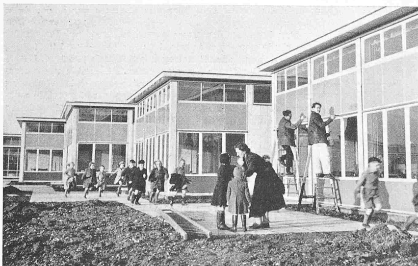
Bild 1. Neues Schulhaus in Stevenage. Der Bau von Schulhäusern gehört wegen der starken Geburtenzunahme zu den dringlichsten Bauaufgaben Englands.

Diese Erscheinung ist nicht zufällig; sie leitet sich aus der zentralisierten öffentlichen Ueberwachung der Bauwirtschaft