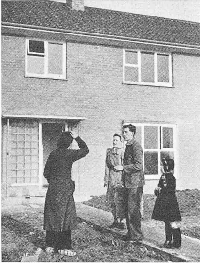
Bild 2. Wohnhaus in Stevenage