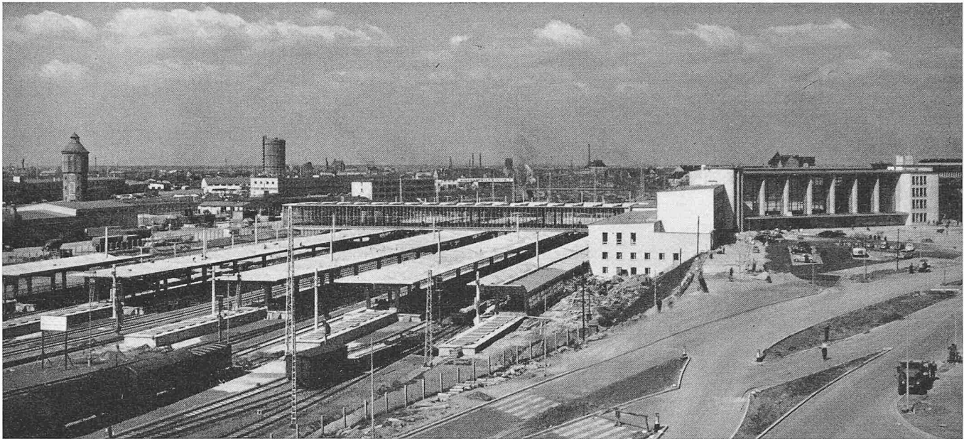
Bild 3. Gesamtansicht der Bahnsteige mit Empfangsgebäude

melde- und Signaltechnik in der Zwischenzeit erhebliche Fortschritte gemacht hatte; diese ermöglichten es, den neuen Bahnhof als Durchgangsbahnhof nicht mit zwanzig, sondern — bei gleicher Leistungsfähigkeit — nur mit sieben bis acht Perrons auszustatten; auch von selbständigen Gepäckperrons ist man heute wieder abgekommen. Ebensovienig benötigt man heute noch ein Dutzend oder mehr Stellwerke wie ehemals. Ein einziges Drucktasten-Zentralstellwerk lenkt den Zugs- und Rangierdienst innerhalb des ganzen Bahnhofes. Während im alten Bahnhof vier mechanische Stellwerke und sechs Bodenwärterposten mit rund 45 Bediensteten nötig waren, wird der gesamte Fahrdienst im neuen Bahnhof von einer Stelle aus geleitet, die mit einem Fahrdienstleiter und einem Weichenwärter besetzt ist.