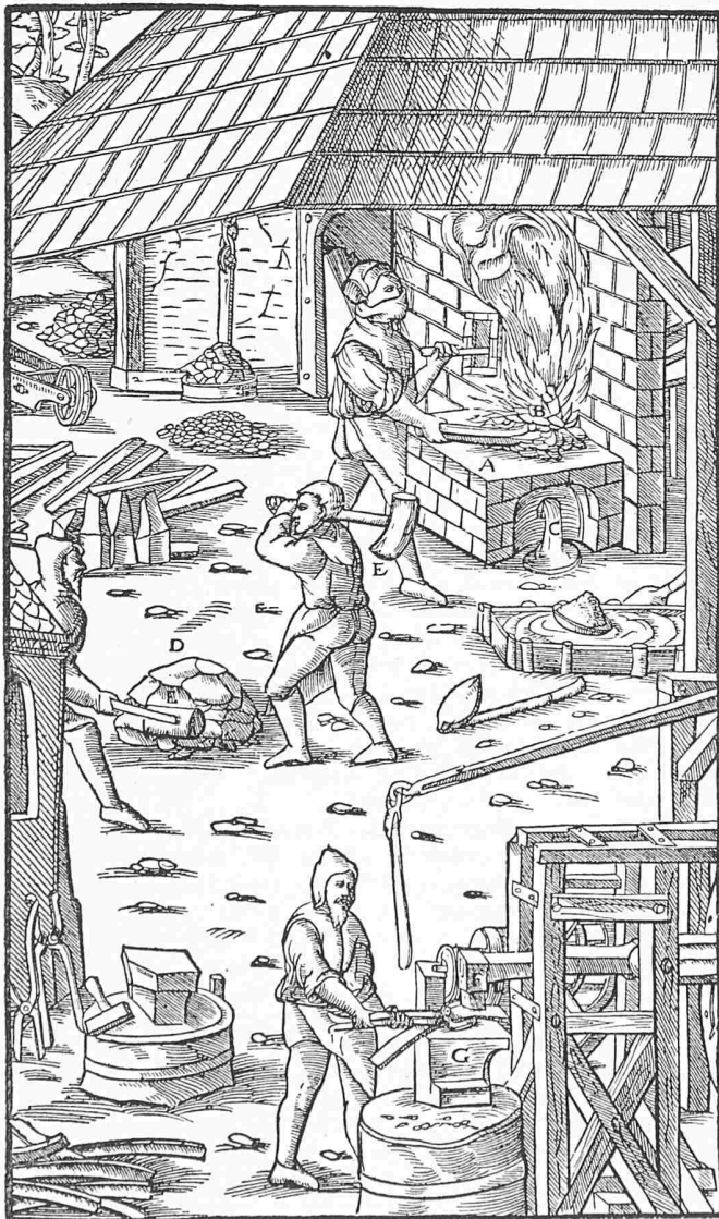
Bild 2. Rennfeuer. A Herd, B Beschickungshaufen, C Schlackenabfluss, D Eisenklumpen (Massel), E Holzhammer, F grosser eiserner Hammer, G Amboss

Das Eisen kommt im «Bermannus» nur an wenigen Stellen zur Sprache. So im 8. Kapitel, wo auf Ancons Frage Bermann antwortet: «Zuerst hat man auf Eisen gebaut, und diesen Bau haben die Goten, die, wie Tacitus sagt, die galische Sprache geredet, angestellt.» Im 18. Kapitel fragt Ancon: Wir haben viele Arten von Kiesen durchgegangen, aber auf den Eisenkies sind wir doch noch nicht gekommen. Avicenna tut desselben Meldung, findet man ihn auch in unseren Eisen-gruben?