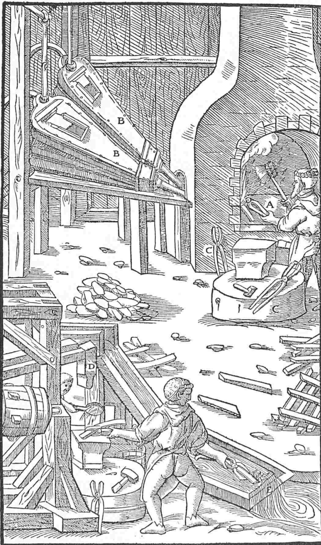
Bild 4. Frischfeuer. A Frischfeuer, B Blasebälge, C Zangen, D Hammer, E fliessendes Wasser

«... Dann stellt man in einem Schmiedefeuer einen Tiegel aus dem gleichen nassgemachten Pulver her, aus dem die Vorherde der Ofen bestehen, in denen Gold- oder Silbererze verschmolzen werden. Der Tiegel sei bis anderthalb Fuss weit und ein Fuss tief. Die Blasebälge werden so gerichtet, dass sie den Wind aus ihren Nasen auf die Mitte des Tiegels blasen. Dieser wird sodann mit besten Holzkohlen gefüllt und rings mit Steinen umgeben, welche die Eisenstücke und die auf sie gelegten Kohlen zusammenhalten. Sobald die Kohlen ins Brennen gekommen sind und der Tiegel glühend geworden ist, lässt man den Wind der Blasebälge an. Sodann bringt der Meister soviel von dem Eisen und dem Schmelzzuschlag hinein, als ihm passend erscheint. In die Mitte legt er, wenn alles weich geworden ist, vier Eisenmasseln, von denen jede dreissig Pfund wiegt, und erhitzt mit starkem Feuer fünf oder sechs Stunden lang, indem er mit einer hinein-