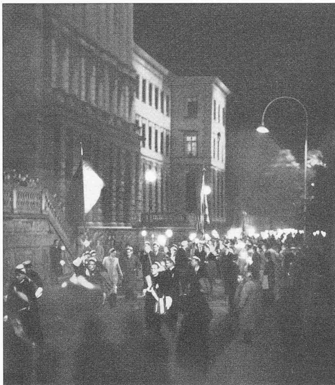
Aufbruch des Fackelzuges der Studenten vor dem Semperbau der ETH am Abend des 19. Oktober 1955