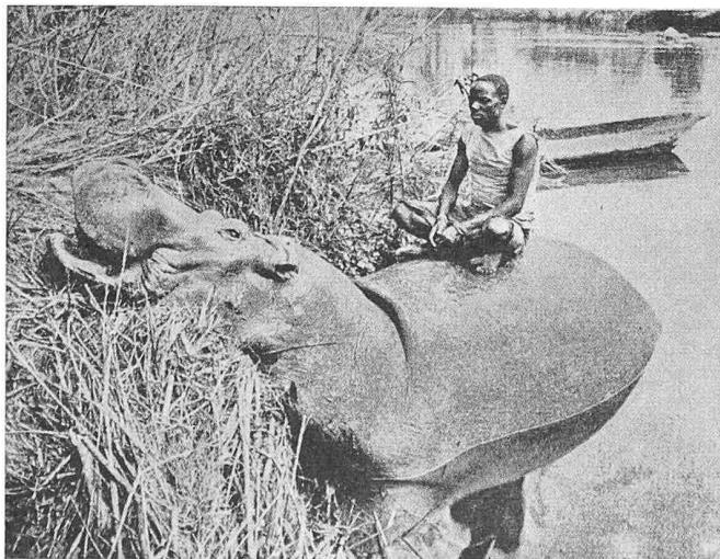
Bild 7. Das erlegte Nilpferd

Oberfläche treiben. Diesmal verlief alles glatt, und nun gab es ein Fest im Dorf, denn das Fleisch — für mich ungeniessbar — ist für den Neger der herrlichste Leckerbissen. Es wurde gesungen und getanzt, und eine Jungfrau erschien mit einem Riesentopf Pombe, dem Negerbier, das der Jumbe schon präpariert hatte, als der Tom-tom mitteilte, dass ich im Kommen sei (Bild 8).