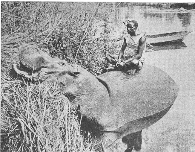
Bild 7. Das erlegte Nilpferd

Oberfläche treiben. Diesmal verlief alles glatt, und nun gab es ein Fest im Dorf, denn das Fleisch — für mich ungeniessbar — ist für den Neger der herrlichste Leckerbissen. Es wurde gesungen und getanzt, und eine Jungfrau erschien mit einem Riesentopf Pombe, dem Negerbier, das der Jumbe schon präpariert hatte, als der Tom-tom mitteilte, dass ich im Kommen sei (Bild 8).