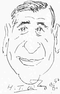
H. T. Adam Conseil de l'Europe Strasbourg