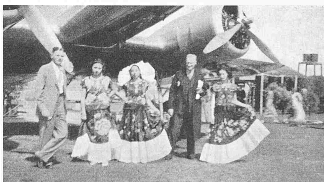
Bild 25. Im Grenzdorf zwischen Mexiko und Guatemala war gerade Kostümfest und die Dämchen liessen sich mit uns photographieren