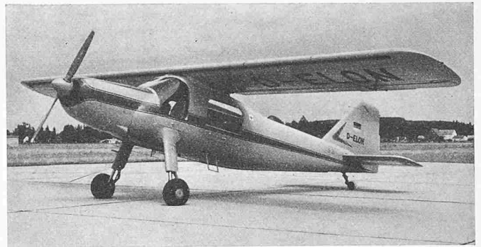
Dornier Do 27 Typenbild. Das Bild zeigt den langen Rumpf, die grossen Seitenleitwerke; auf Bild 1 erkennt man den stets geöffneten durchlaufenden Schlitzspalt in der Flügel-nase, den Landeklappen-Doppelspalt und die vorbildliche Sicht vom Führersitz aus

Die Landeklappen lassen sich bis 45° verstellen; sie sind, wie die Querruder, an der Eintrittskante mit einem Doppelspalt versehen und um eine feste Achse innerhalb des Flügelprofils drehbar gelagert. Ruder- und Flossenflächen der Heckleitwerke sind reichlich bemessen; der Rumpf ist verhältnismässig lang. Grosse Fenster geben gute Sicht und erleichtern das Ein- und Aussteigen.