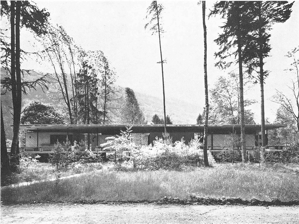
Garderobengebäude im Gäsi am Walensee. Architekt J. Zweifel, Zürich und Glarus