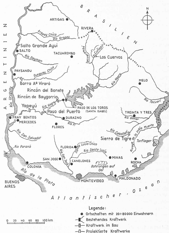
Bild 1. Uebersichtskarte der verfügbaren Wasserkräfte von Uruguay

Unmittelbar vor Ausbruch des Zweiten Weltkrieges wurde der Ausbau der vorhandenen Wasserkräfte an die Hand genommen. Der grösste Fluss des Landes, der Río Negro, dessen Quellen im südlichen Brasilien, im Staate Rio Grande do Sul, liegen, erscheint dafür am geeignetsten. Die hydrologischen Verhältnisse des Landes sind eigenartig. In Uruguay gibt es keine ausgesprochene Regenzeit; beinahe zu jeder Jahreszeit können gewaltige Regenfälle oder aber auch ausgedehnte Trockenperioden auftreten. Die Regenmenge am Mittellauf des Río Negro, bei der Pegelstation Paso de los Toros, beziffert sich etwa auf 1150 mm im Jahr. Die Wasserführung des Río Negro zeigt viel ausgeprägtere extreme Wasserstände als die europäischen und schweizerischen Flüsse. An der Pegelstation Paso de los Toros wurden in der 38jährigen Beobachtungsperiode 1908—1945 als kleinste Wasserführung 1,0 m 3 /s festgestellt; als Katastrophenhochwasser sind 11 500 m 3 /s zu erwarten. Aber nicht nur die sekundliche Ergiebigkeit des Flusses zeigt derart grosse Schwankungen, sondern auch die jährliche Gesamt-