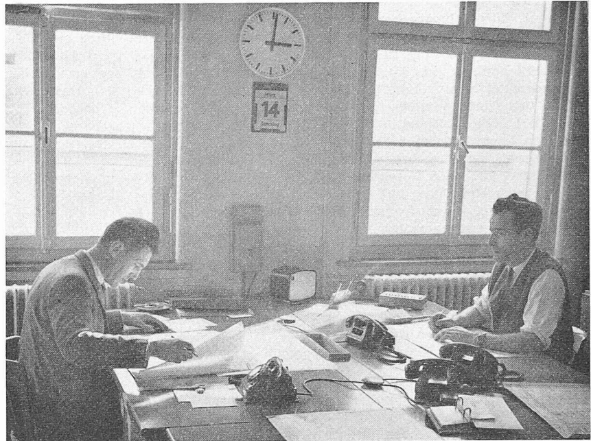
Zugüberwachung «Südbahn» (Meldeeinrichtung noch alt)