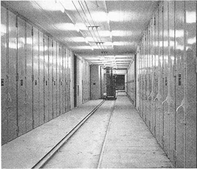
Bild 8. Transport der Dachziegel in die Kammertrocknerei mit Schiebebühne und Absetzwagen