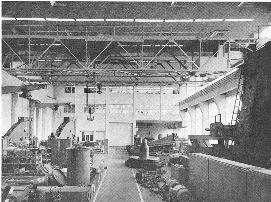
Bild 2. Innenansicht der Halle; hinten die Zugänge (Schleusen), darüber die Konstruktionsbüros; an der Decke die Anemostaten für die Zuluft

Sämtliche Zugänge sind als Schleusen ausgebildet. Für Personen steht eine Schleuse mit drei hintereinanderliegenden Türen zur Verfügung. Für die Werkstücke eine grosse (4,8 Meter hoch mal 10 m lang mal 4,8 m hoch), für Elektrokarren mit kleineren Werkstücken eine kleine (2 mal 10 mal 3 m). Die Innen- und Aussenrolltore der beiden letztgenannten Schleusen lassen sich nur wechselweise betätigen, so dass immer eines von ihnen geschlossen ist. Sie bestehen aus Federrolladen, deren Eigengewicht durch Stahlfedern ausgeglichen wird, und besitzen zwischen doppelten Stahllamellen eine isolierende Schicht. Die grosse Schleuse wird durch eine besondere Anlage ebenfalls auf einer konstanten Temperatur von 20° C gehalten. Die Werkstücke kommen in vorgearbei-