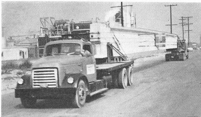
Bild 8. Transport eines 35 m langen I-Trägers, mit zwei antreibbaren Lastfahrzeugen. Das vordere zieht und das hintere bremst, um die Kippgefahr zu vermindern

Es steht dem Verfasser nicht zu, sich in die architektonisch-ästhetischen Probleme der Vorfabrikation einzulassen. Es sei jedoch Le Corbusiers bewundernder Ausspruch in Pisa zitiert: «Unité dans le détail, tumulte dans l'ensemble», und in etwas gemässiger Form weiterverwendet: «Unité dans les détails, diversité dans les volumes». Dieses Prinzip hat lange vor der Industrialisierung im Bauwesen schon gegolten und gerade damit findet es seine vollständige Anwendung. Es handelt sich ja nicht darum, Häusertypen, sondern Elementtypen zu bauen.