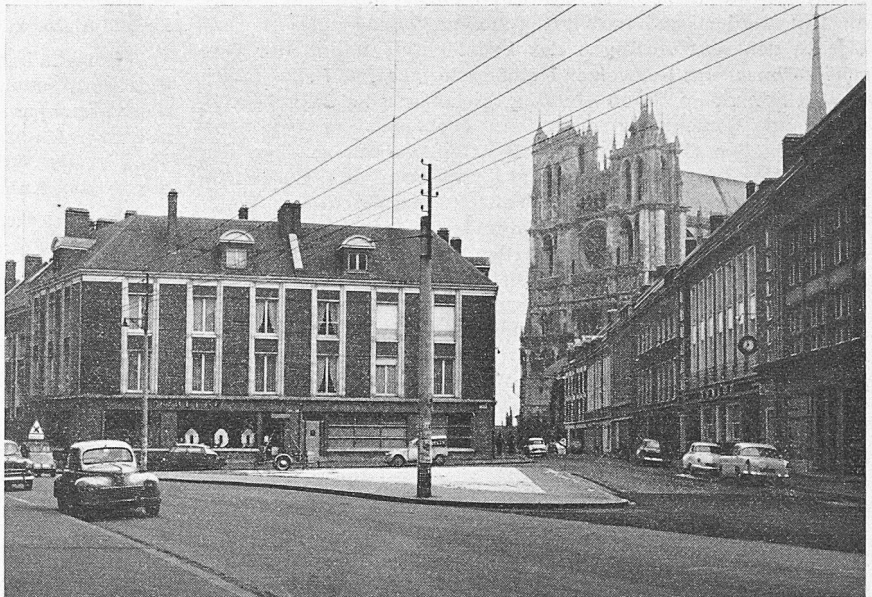
Amiens, Rue Deserel et Cathédrale