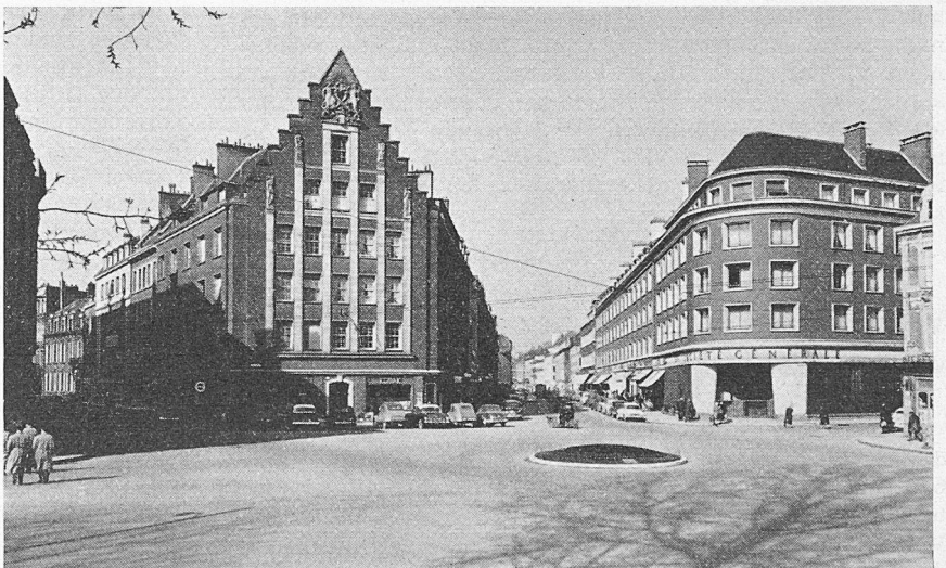
Amiens, Place René Goblet