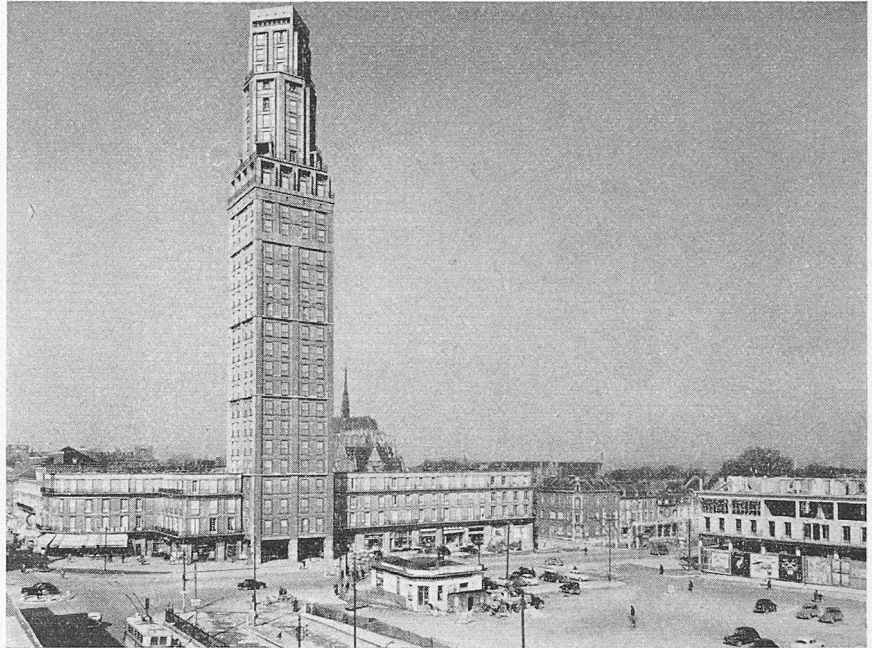
Amiens, place Alphonse Fiquet et Tour Perret, haute de 104 m

Die Studienreise nach Skandinavien , die der Verband mit 28 Teilnehmern im vergangenen Sommer durchgeführt hat, muss ein ausserordentliches Erlebnis