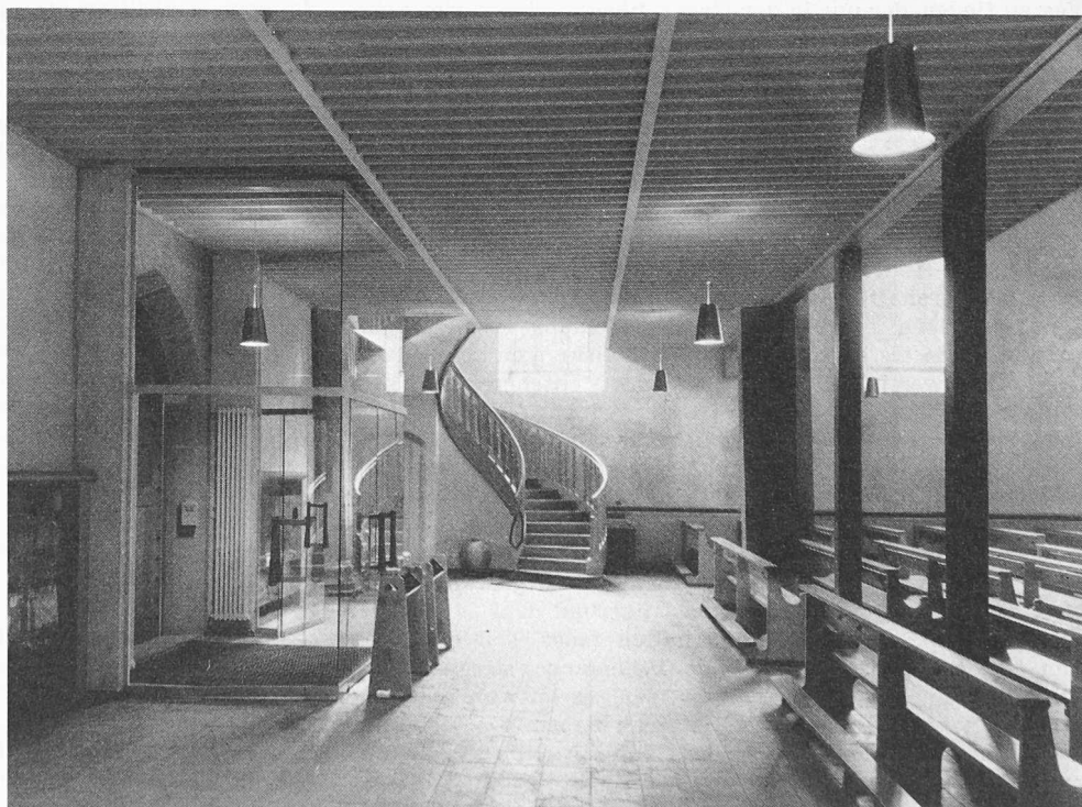
Eingangspartie mit Treppe zur Empore

menschliche Wirksamkeit zu erschaffen, noch Fehlhandlungen, die sie gefährden könnten, ein für allemal zu verunmöglichen. Vielmehr dürfte es unsere Aufgabe sein, die unser Menschsein begründenden Werte und ihre dauernde Gefährdung als Grundgegebenheiten des menschlichen Daseins anzuerkennen und mit solchem Bejahen des Schicksals auch