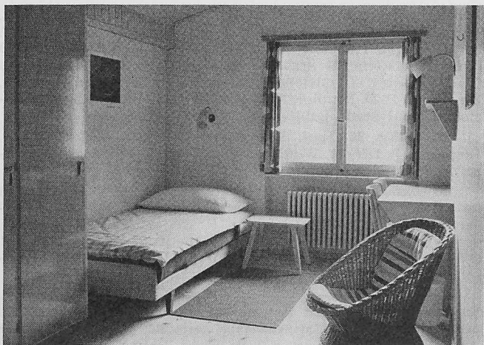
Die Ein- und Zweibett-Zimmer der Chesa Selfranga sind sehr wohnlich und praktisch eingerichtet.

Es scheint, dass vielen G. E. P.-Mitgliedern noch nicht bekannt ist, dass sie in Klosters im Prätigau zu äusserst günstigen Bedingungen sowohl die Sommer- als auch die Winterferien verbringen können. Im neu umgebauten Haus stehen freundliche und komfortable Zwei-, Drei- und Mehrbettzimmer zur Verfügung. Das Haus eignet sich daher auch vorzüglich als Hotel für Familien mit Kindern. Die vom Verband Schweizer Volksdienst geführte Küche bedarf keiner besonderen Empfehlung.