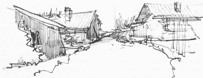
Aus der Ausstellung der Genfer Architekturschule im Musée Rath, Mai 1963

Als Auftakt der Genfer Veranstaltungen des S. I. A. fand am Freitag, den 17. Mai 1963 um 11 Uhr die Eröffnung der Ausstellung statt, welche die Ecole d'Architecture der Universität Genf (s. SBZ 1963, S. 324) im Musée Rath aufgebaut hatte. Inmitten der Schülerarbeiten aller Stufen, die in Plänen, Perspektiven und Modellen Wände und Tische füllten, drängte sich ein festlich gestimmtes Publikum. Nachdem