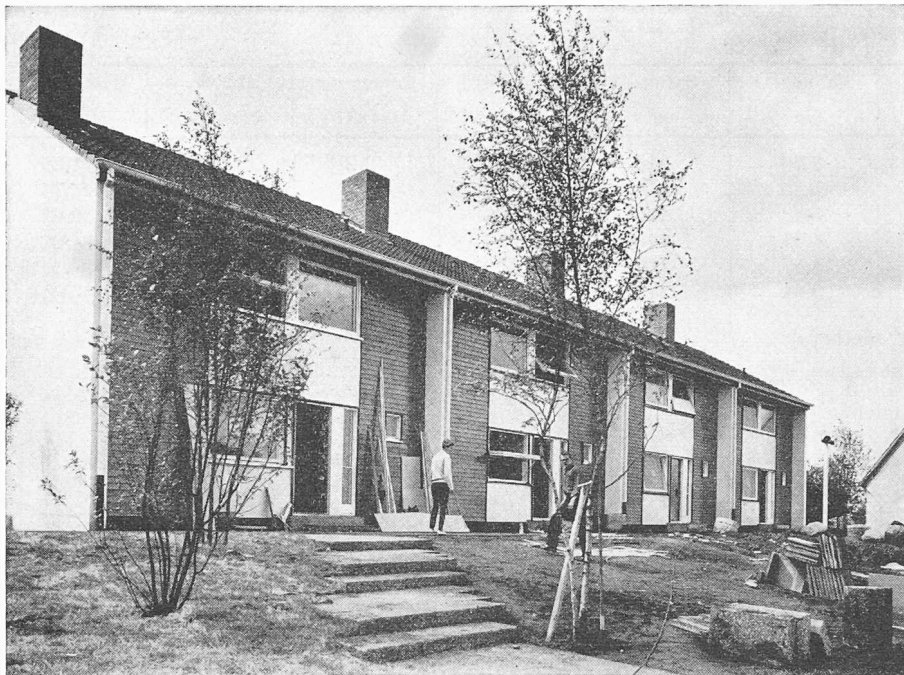
Haus 18—21. Finnische Reihenhäuser der Firma Puutalo. Je 4 Zimmer auf 2 Geschossen, 108 m 2 Wohnfläche, 300 m 2 Grundstück, Preis ab Oberkante Keller 53 000 Mark; Gesamtpreis 97 500 Mark; vollunterkellert. — Neben dem Keller sind die Brandmauern zwischen den einzelnen Häusern in konventionellem Ziegelmauerwerk ausgeführt; alles andere besteht aus vorfabrizierten Holzelementen mit Isoliermaterialien. Montagedauer zwei Wochen. Reichhaltiges Typenprogramm von Einzel- und Reihenhäusern in allen Grössenordnungen.

sische Statistische Amt hat in entgegenkommender Weise die Tabellierung der Ergebnisse übernommen. So ist es möglich, dass die Resultate jeweils bereits drei Wochen nach Monatsende zur Verfügung stehen.