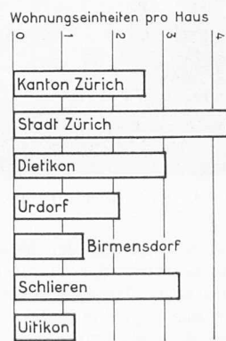
Bild 2. Anzahl der Wohnungseinheiten je bewohntes Haus 1960

Steuerkraft = Ertrag der allgemeinen Gemeindesteuer (ohne Personalsteuer) auf Steueransatz von 100 % umgerechnet