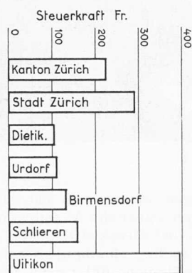
Bild 1. Steuerkraft 1960 in Franken je Einwohner